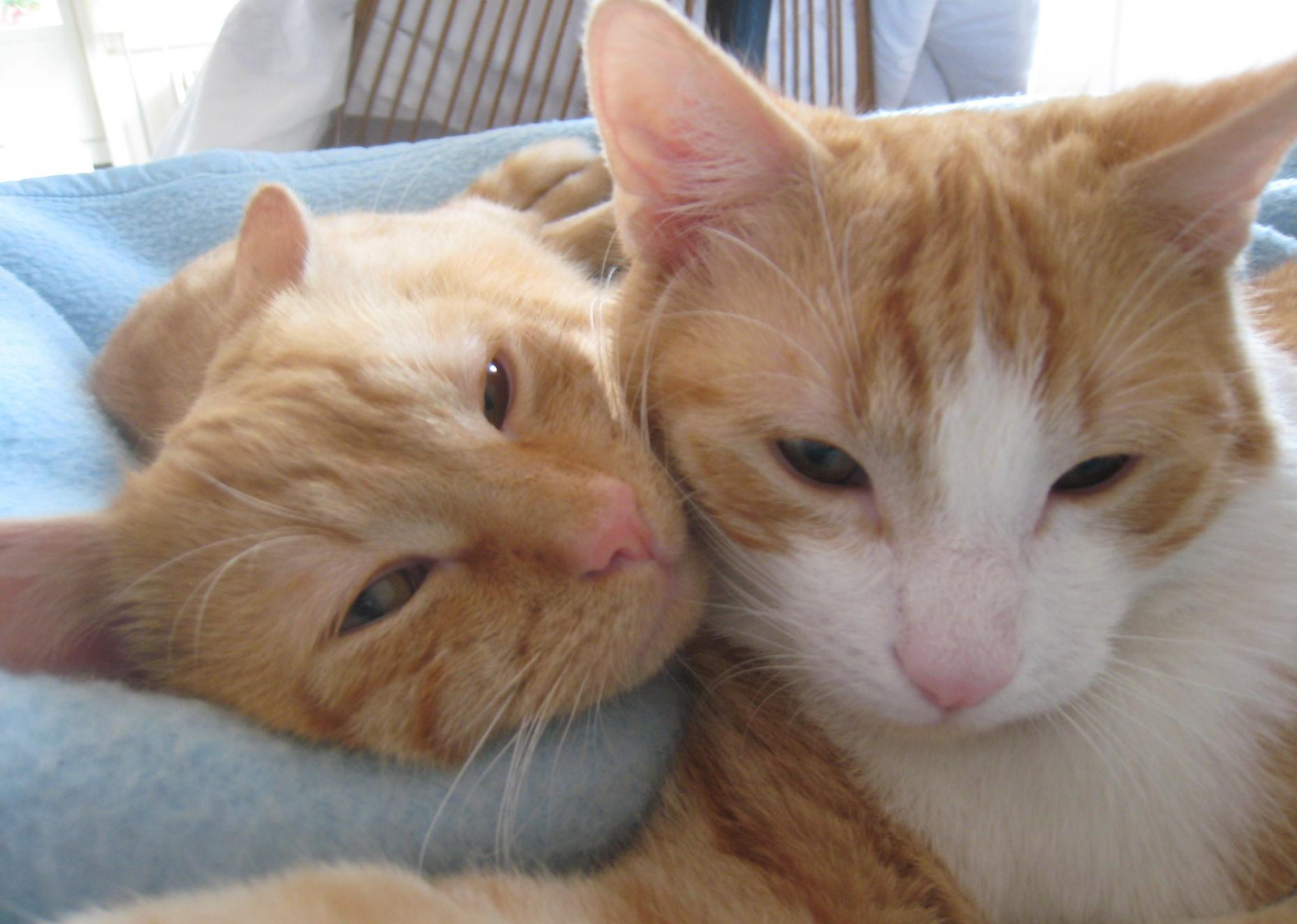
Nestor & Pollux ont été intégrés dans l'équipe en janvier 2011